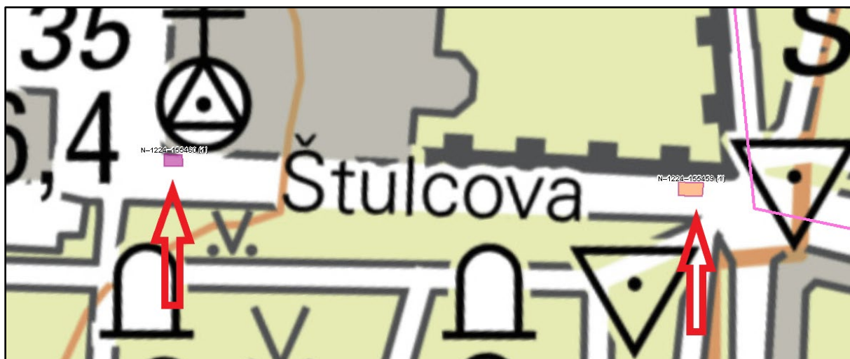
Obr.6. Vyznačení obou sond v mapovém okně AMČR.